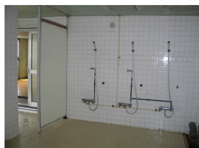
1F 大浴室（シャワー全22台）